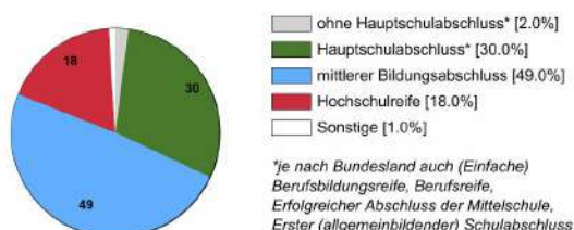
Ausbildungsbereich Industrie und Handel